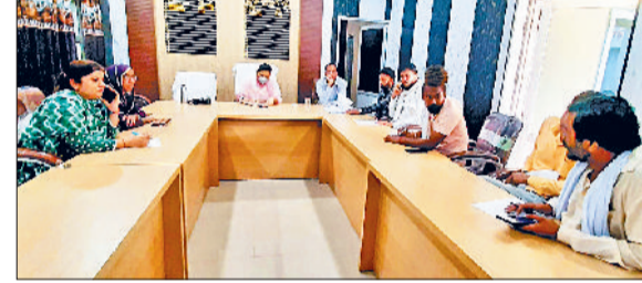
मूना। विकास कार्यों पर चर्चा करती हुई चेयरपर्सन, पार्षद तथा अधिकारी।