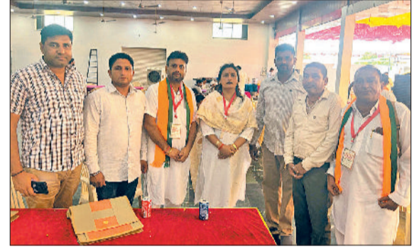
मूना। भाजपा की जिला स्तरीय बैठक में पहुंचे पार्षद।