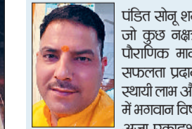
अच्यंते फलदायी बनाता है।