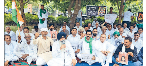
सिरसा। लघु सचिवालय में धरने पर बैठे विभिन्न संगठनों के सदस्य।

सिरसा। रक्तदानियों को सम्मानित करते संस्था के पदाधिकारी।